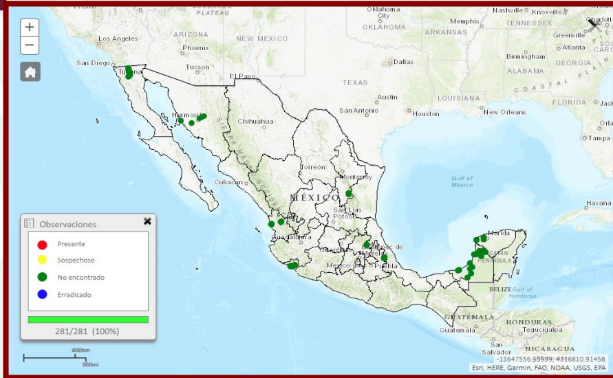
Observaciones registradas del 01 de enero al 31 de mayo de 2024